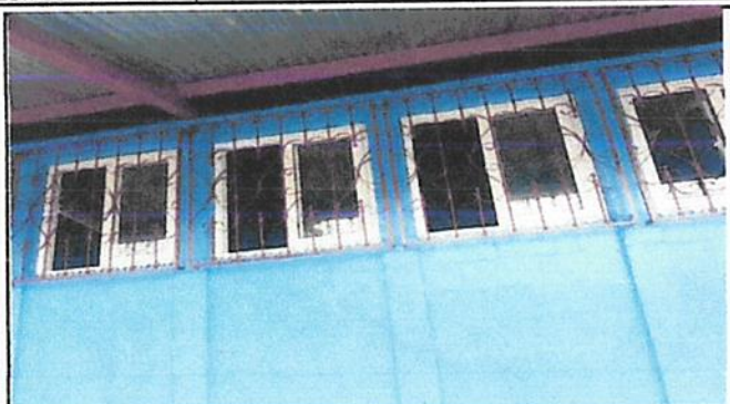
Foto1: Instalacion de ventanas